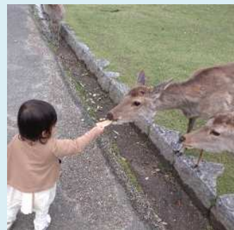
『鹿と交流するわが娘』