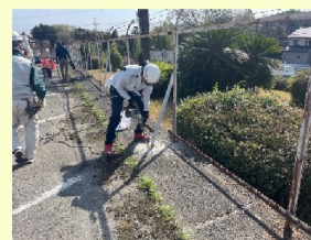
既設フェンス解体