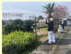
新規フェンス取付け