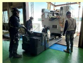
電動パレットトラック