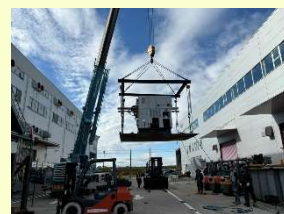
クレーンにて吊り上げ