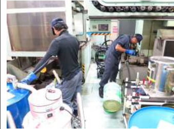
③廃油バキューム+清掃