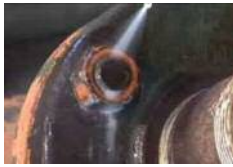
錆びたボルトも楽々除去

ので逆さ噴射もOKです。複雑な構造物の一部あるいは、奥まった場所に使用することにも便利です。こちらの冷却浸透剤スプレー『スーパー助っ人君』に関するお問合せはSNGまでどうぞ。