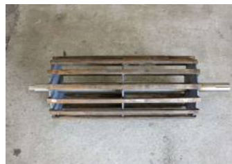
新品シャフトをプリーに接合