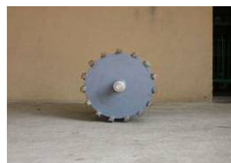
修復後のテールプリー(側面より)