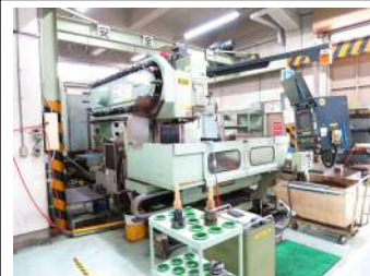
①マシニングセンタ1

お客様の工作機械、油の交換は定期的に行なっていますか？酸化して茶色くなった工作油は、冷却不足や潤滑性の低下による磨耗・傷の発生など、トラブルの原因となります。工作機械の油交換は定期的に行ないましょう。適正な管理によって、トラブル減少、製品品質の向上に繋がります。下の写真はマシニングセンタの更液事例です。2種類のタンク廃油バキュームと清掃を実施後、新油を投入し作業時間は5時間少々です。SNGでは、工作油の交換工事を受け付けております。お気軽にお申し付け下さい。