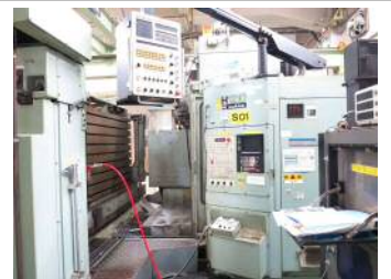
②マシニングセンタ2