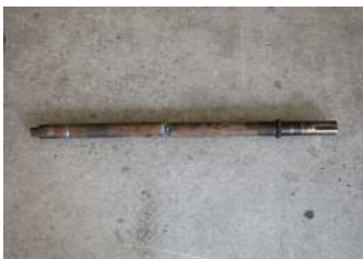
テールプリー取り外したシャフト

SNGのRE (Reverse Engineering) サービスの事例をご紹介します。コンベアの部品として用いられるテールプリーのシャフトが磨耗し、溶接が外れてしまったため修理のご依頼をいただきました。まず、テールプリーからシャフトを引き抜き、現品を見本に新品のシャフトを機械加工で製作、その後溶接にてプリーに接合しました。元通りに修復でき、お客様にお喜びいただいた事例です。機械部品の現物合わせによるリバースエンジニアリングのことなら、SNGの営業担当までお気軽にご相談下さいませ。