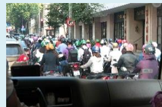
『ホーチミンの印象』

コロナ後に訪れたい国として最も人気のある国は日本だそうです。自由に旅行が楽しめる日が早く訪れる事を切望する毎日です。