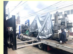
ラジアルボール盤

販売も実施しています。「大型旋盤が欲しい!」、「8軸制御の複合加工機を探しているが見つからない」など、ご要望・お困りごとはエス・エヌ・ジーにご相談下さい。お探しの型式及びそれに類似した機能を持つ商品をご提案します。